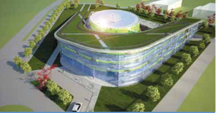
Ar-Ge ofisleri ve Kulučka Merkezi ile hizmet verecek İZTEKGEB İnovasyon Merkezi

Bu kapsamda yaklaşık 1,5 Milyon TL toplam bütçeli 2 ayrı program yürütüldü ve deđerlendirmeler sonucunda 39 başvuru başarılı bulunarak Ajans tarafından desteklendi.